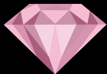
Tiktok Diamonds (다이아)

나만의 스타일로 라이브 스트리밍을 해보시고 선물과 응원을 받아보세요! (대화, 노래, 기타 등등...)